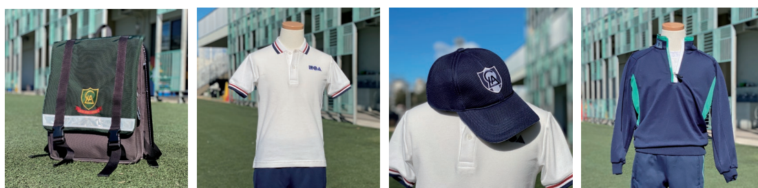
スクールリュック

※上記のほか、iPadケースやLCAファイル等の指定文具代が別途かかります。 ※通常の登下校時には必ずスクールリュックを使用していただきます。