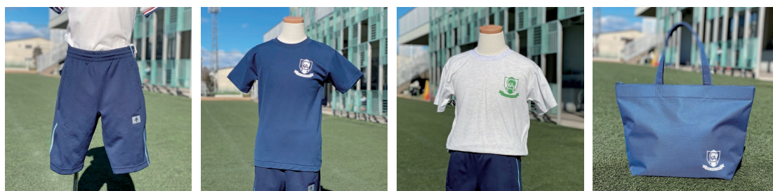
ハーフパンツ(ジャージ下)