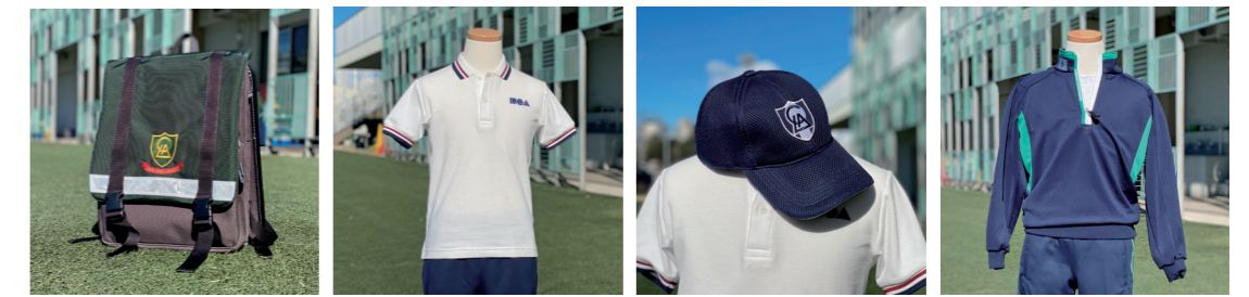
スクールリュック ポロシャツ(ホワイト) LCAキャップ トレジャツ(ジャージ上)

※上記のほか、iPadケースやLCAファイル等の指定文具代が別途かかります。 ※通常の登下校時には必ずスクールリュックを使用していただきます。