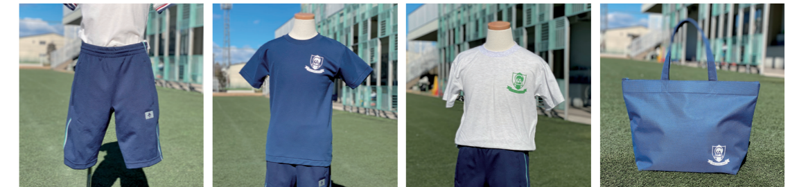
ハーフパンツ(ジャージ下) Tシャツ(ネイビー) Tシャツ(アッシュグレー) サブバッグ